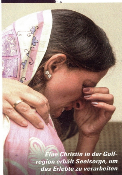
Eine Christin in der Golfregion erhält Seelsorge, um das Erlebte zu verarbeiten