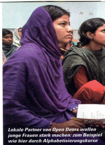
Lokale Partner von Open Doors wollen junge Frauen stark machen: zum Beispiel wie hier durch Alphabetisierungskurse